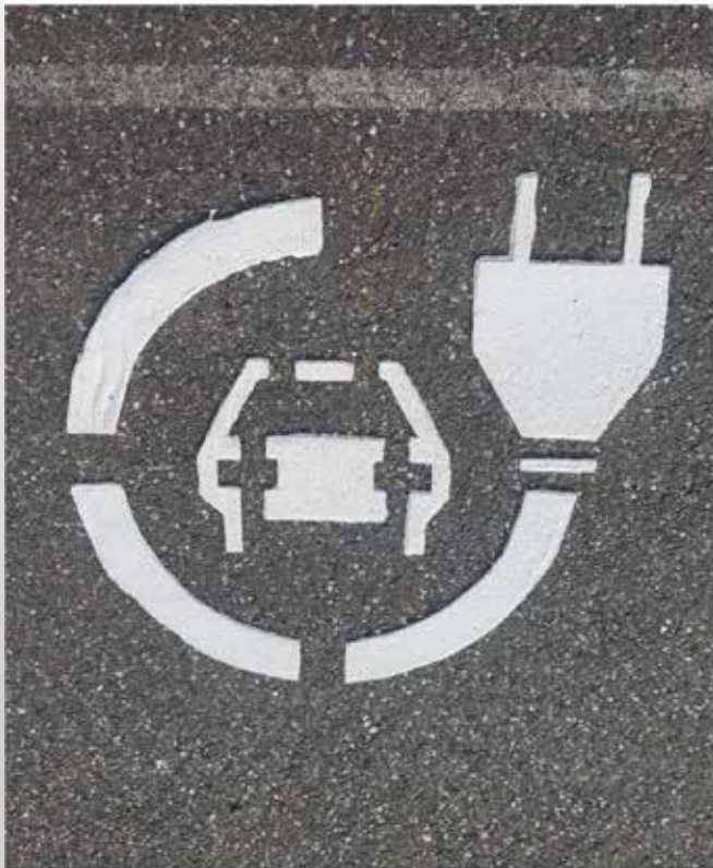
Stikje service fan „de Helling“