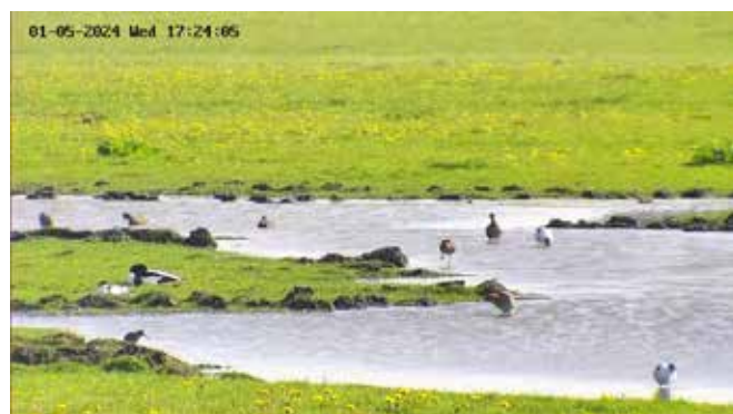
De natuurlijk gevormde plasdras trekt dit voorjaar vele vogels

Melkveehouder Marten de Jong opende de vergadering en memoreerde dat de verbinding in de Húnserpolder een belangrijke basis van succes is. "We dragen allemaal ons steentje bij, ieder op zijn eigen vakgebied".