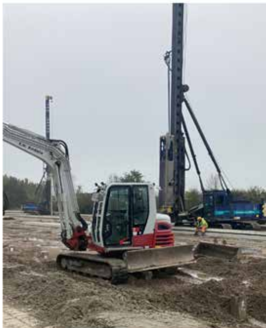
Hast net te sjen, mar wol te hearren! (Dewulf 1000 peallen 50 deis)