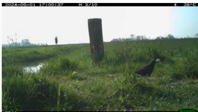
De zwarte kraai met een eendenei in de bek (opname gemaakt met een cameraval bij Rewert)